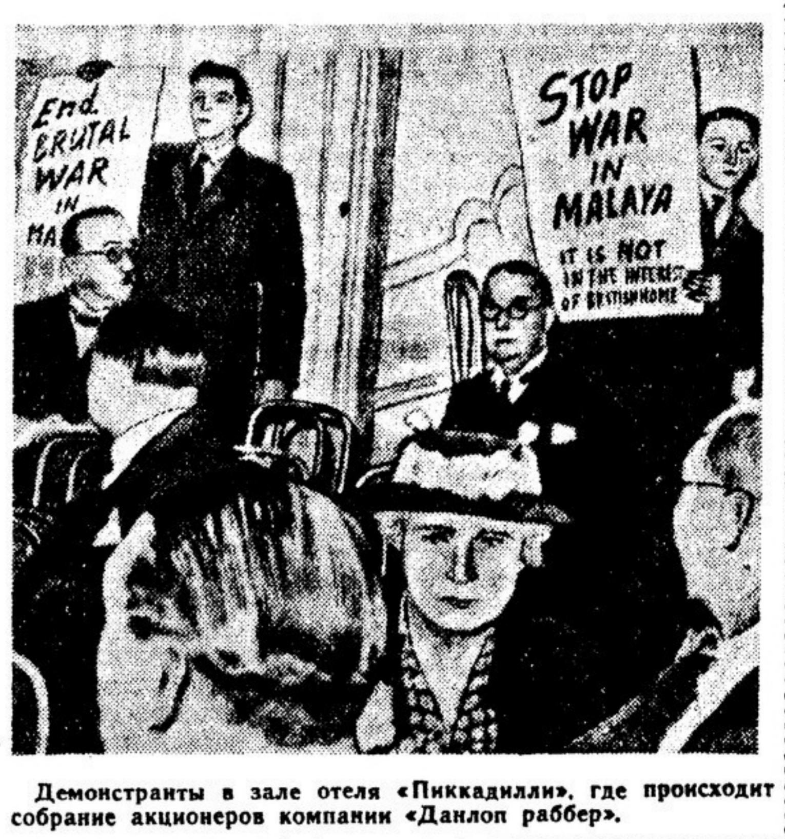
Демонстранты в зале отеля «Пиккадилли», где происходит собрание акционеров компании «Данлоп раббер».