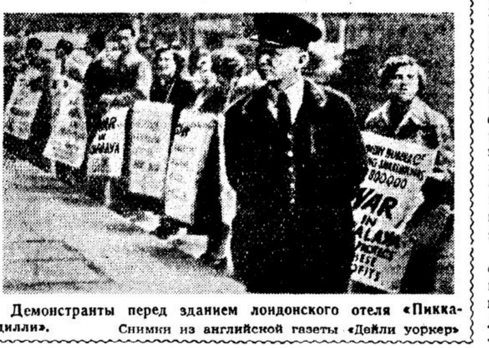
Демонстранты перед зданием лондонского отеля «Пиккадилли». Снимок из английской газеты «Дейли уоркер»

Английская общественность требует прекращения малайской войны. На многотысячном митинге, организованном в Гайд-парке Лондонской женской ассамблеи, была принята резолюция, призывающая «отчас же принять меры, чтобы положить конец войне в Малайе». Подобные резолюции принимаются на многих собраниях трудящихся Англии.